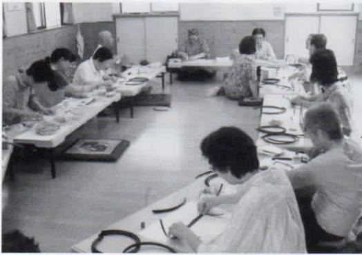
手提げバッグづくりに熱心に取り組む参加者