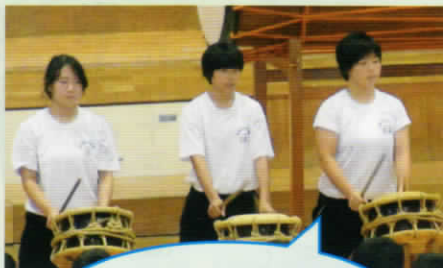
愛鷹太鼓保存会の方々にご指導を受けて完成させました

九月十九日(出) オープニングは、有志22名による勇壮な愛鷹太鼓の演奏でスタート。