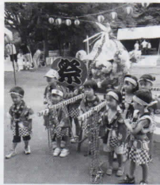
お神輿ワッショイ!!

朝から蝉が鳴く中、八月一日(出)第40回夏祭りが行われました。昭和四十七年に町ができた直後から始まり、手作り感たっぷりのお祭りです。