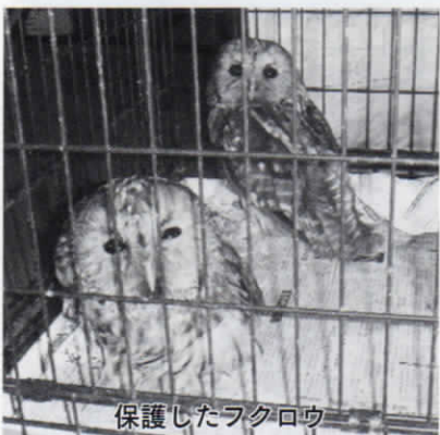
保護したフクロウ

尚、手負いの鳥獣は気が荒くなっていますから危険です。可哀そうだからと手を差し伸べて、怪我をしてしまう場合もありますので、