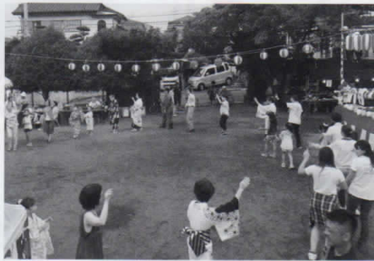
輪になって踊ろう

今年「家族そろって全員集合!」輪になって踊ろう」のテーマを掲げ、童心にかえってフオークタン