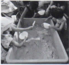
ああ、逃げちゃった〜

酒樽に飾りをつけた子ども神輿が町内を練り歩き、元気な声に誘われ皆さんがお賽銭を入れてくれます。その後、子ども会の宝探し、ゲーム、メダカすくいと続き、夕方からは模擬店が始まります。メニューは焼きそば、かき氷、生ビールなどの種類と豊富です。中学生も売り子、放送と手伝いをし、みんなで盛り上げます。