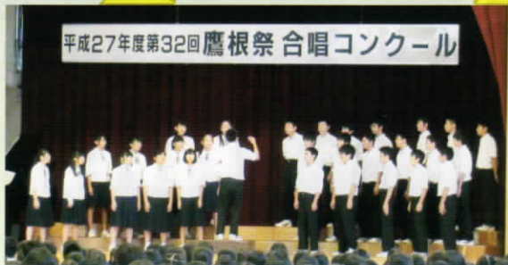
平成27年度第32回鷹根祭 合唱コンクール