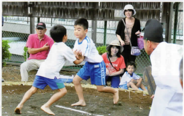
「のこった、のこった！」青野子どもすもう大会 (8月29日)