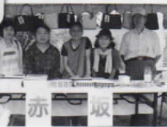
夏祭りでの出店風景

「赤坂サロン」が毎月行われるようになって二年。スタッフの皆さんも、楽しみの輪がもつともっと広がっていくよう、あれこれ話し合っ取り組むことに、やりがいを感じているようだ。「アカサカワールド」というホームページでも自治会員に活動を紹介、閲覧してもらっている。