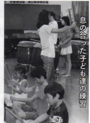
息の合った子ども達の練習

上のコミュニケーションはせずとも、呼吸の合った練習をしていることにおどろかされました。「和」の演奏一実に見事でした。その後、大人の部の練習がスタート。