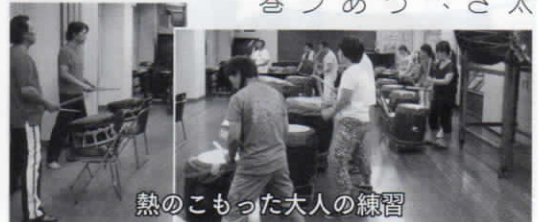
熱のこもった大人の練習

大小様々な太鼓から繰り出される音の洪水、複雑に絡み合うリズム、迫力あるパフォーマンスはまさに圧巻でした。 芸術祭での成功を祈りつつ、その場を後にしました。(佐藤俊)