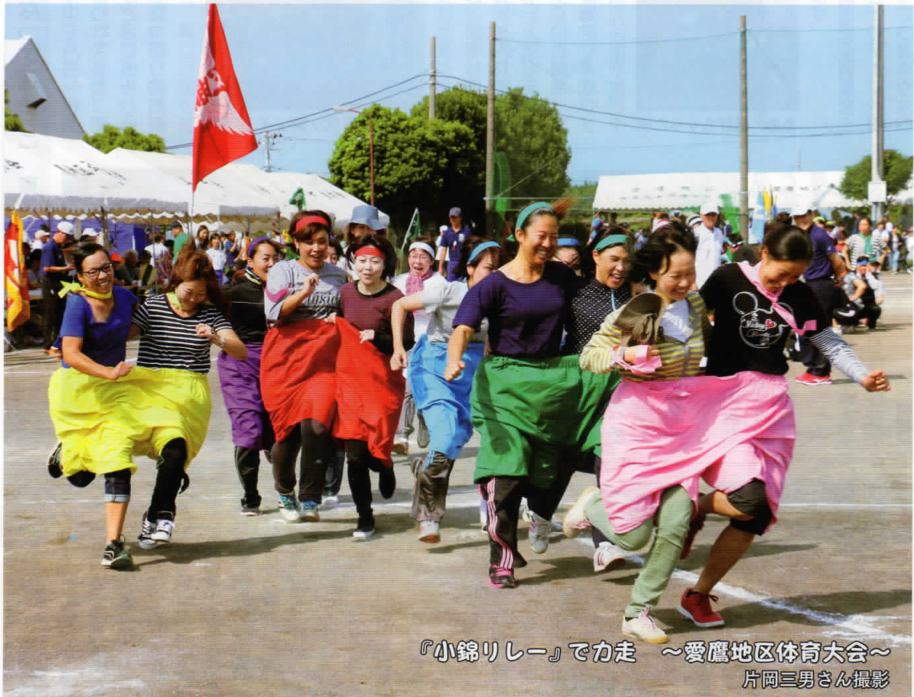
『小錦リレー』で力走 ～愛鷹地区体育大会～