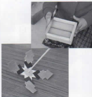
クラフトテープのコマ