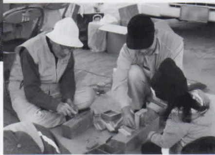
ソープボックス(石鹸入れ)を作りました