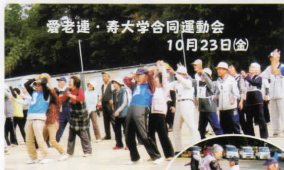
秋晴れの下、元気いっぱい、 笑顔いっぱい!