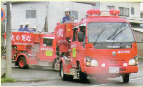
防火パレードを実施しました(11月8日)

愛鷹方面隊では地域の防災リーダーとして活躍する消防団員を募集しています。普段の生活では知り合えない仲間との繋がり、仕事では経験できない活動を、一緒に体験しませんか。(益田)