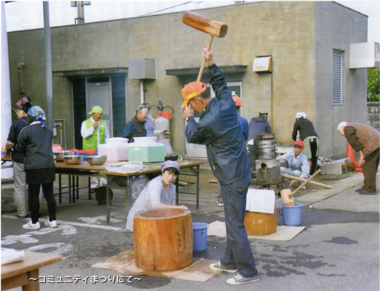
～コミュニティまつりにて～

愛鷹地区コミュニティ推進委員会 TEL・FAX 966-5301 (愛鷹地区センター)